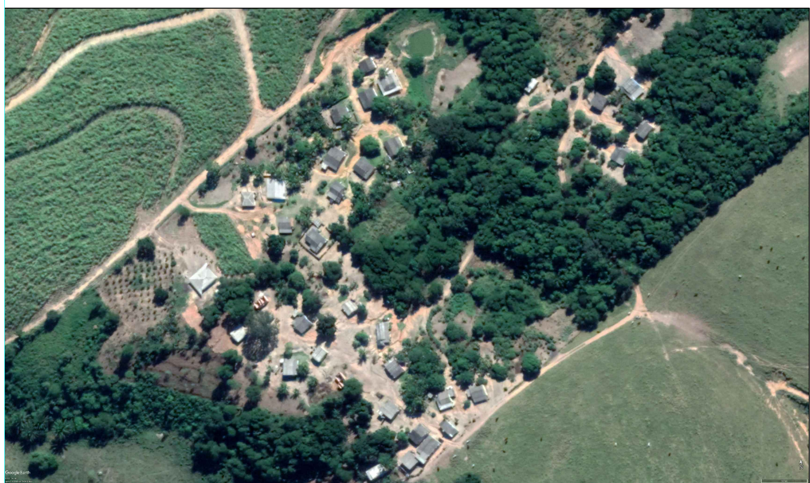
02 PLANTA DE SITUAÇÃO